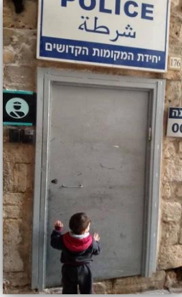
Polis merkezinin kapısında annesini bekleyen Filistinli çocuk