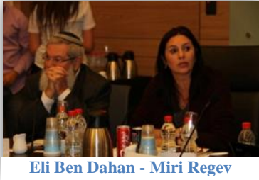
Eli Ben Dahan - Miri Regev

2013'ü hazırlık ve beklentilerle kapatan işgalci İsrail için, 2014'ün en önemli özelliği kartların açıktan oynanmaya başlandığı bir yıl olmasıydı. İsrail kurulduğundan beri "adım adım" siyasetiyle Kudüs ve Aksa'nın egemenliğini elde etmeye yönelik çalışmalar yürütülürken, 2014'teki açıklamalar ve uygulanan siyaset, siyonist politikacıların, bölge ülkelerdeki olumsuz gelişmelerin sağladığı uygun ortamda, hedeflerine ulaşmak için gerekli aşamaları "sıçrayarak" kat etmeye karar verdiklerini göstermekteydi.